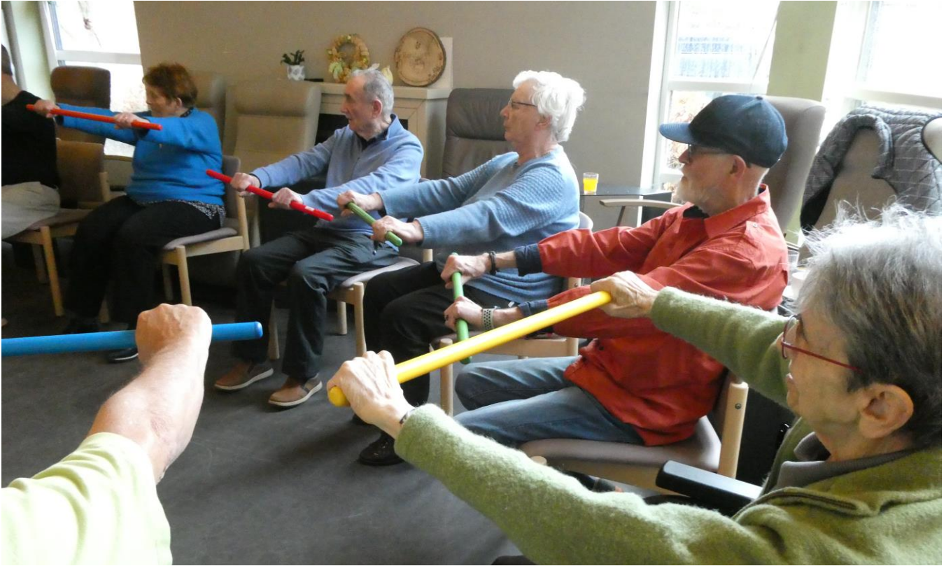
Week van de valpreventie